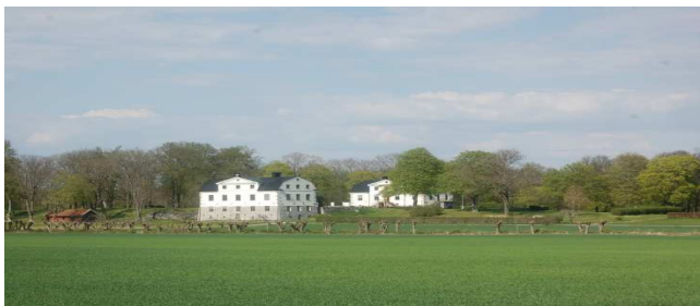
Målhammar allé (byggnaderna utgörs av det ursprungliga slottets ändar vilka blev kvar när mittdelen revs, jämför bilden på nästa sid).