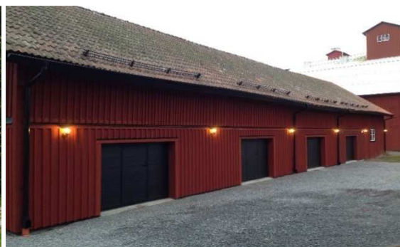
Spelbo Gård, stora logen med kallgarage och gamla vagnslidret med nybyggda varmgarage.